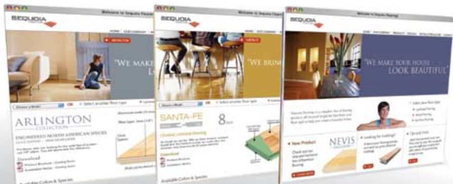
SITE INTERNET - SEQUOIA FLOORINGS WEB SITE - SEQUOIA FLOORINGS

Depuis sa fondation en 2001, Sequoia floorings a connu une croissance extraordinaire comme nouveau joueur dans un segment de marché déjà réputé très compétitif : le recouvrement de planchers. Nous sommes intervenus très tôt sur l'image de marque de l'entreprise, que ce soit pour la communication interactive ou imprimée. Nous avons ainsi créé une image forte et crédible auprès des consommateurs, mais aussi des distributeurs nord-américains.