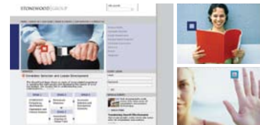
STONWOOD GROUP www.stonewoodgroup.com