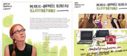
ILLUSTRATIONS MARIE-ANDRÉE BUREAU www.mabureau.com