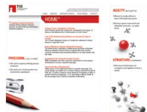
TECHNICAL SECURITY & INTELLIGENCE www.tsintel.com